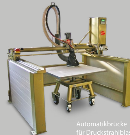
Automatikbrücke für Druckstrahlblaster

Wir möchten, dass Sie rundum zufrieden sind. Daher gehört die Lieferung, Aufstellung und Inbetriebnahme unserer Geräte genauso zu unserem Service, wie unser umfangreiches Ersatz- und Verschleißteilangebot auch für ältere Baureihen. Wir kennen und schätzen den Wert jedes einzelnen unserer Geräte und daher halten wir auch für „Oldtimer“ ein umfangreiches Ersatzteilangebot auf Lager.